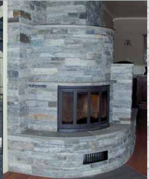
Peis i tørrmur (Norheim Naturstein AS).