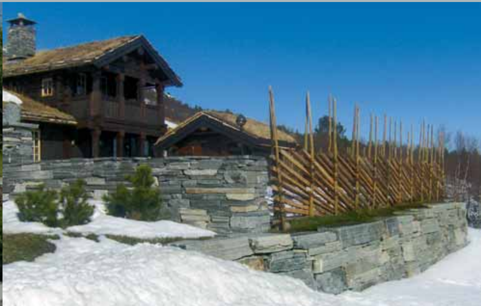
Mur av tørrmur. Til høyre murblokk.