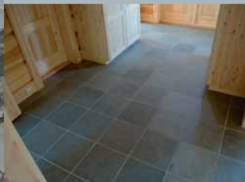
Kvadratisk gulvflis i gang.