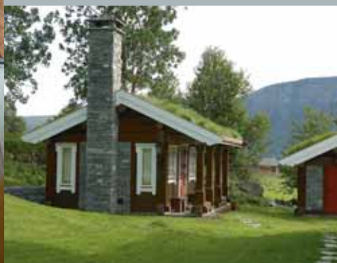
Pipe forblendet med tørrmur.