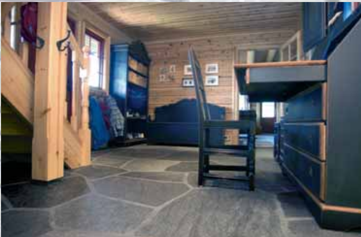
Gulv med flisemner som råstoff (Geir Dahle).