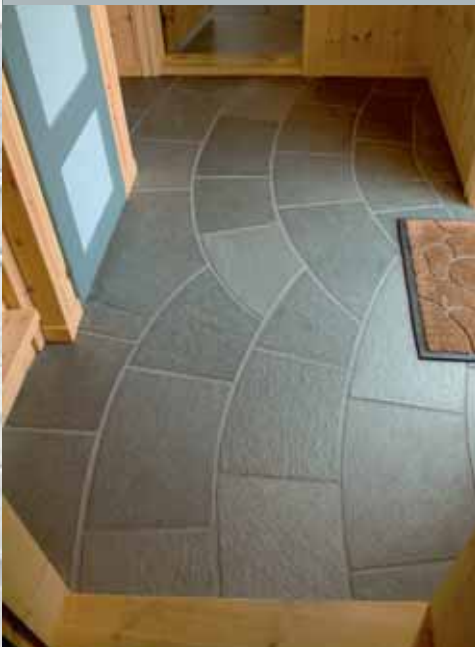
Spesielt tilpasset gulvflis i gang.