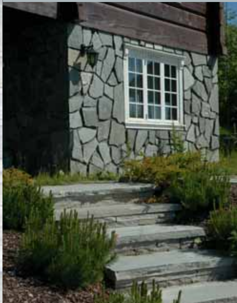
Grovplastring på vegg. Trapp av terrengrinn.