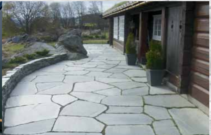
Uteplass med bruddheller og tørrmur.