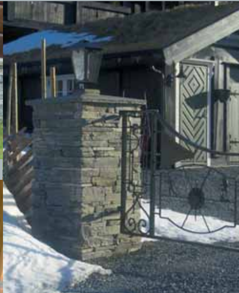
Portstolpe i tørrmur.