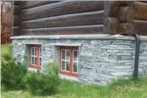
Mur m/avdekning på toppen. Vindusomramming i skifer.