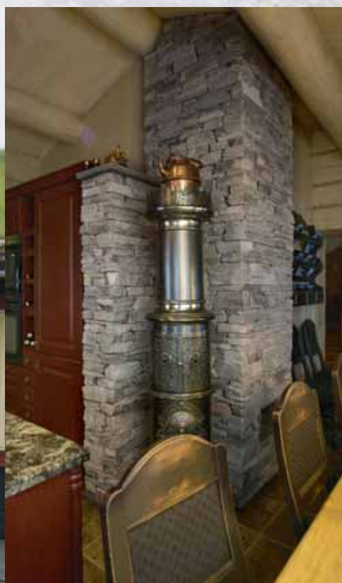
Pipe forblendet med tørrmur (Geir Dahle).