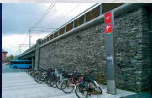
Tørrmur, belegningsheller på fortauet.