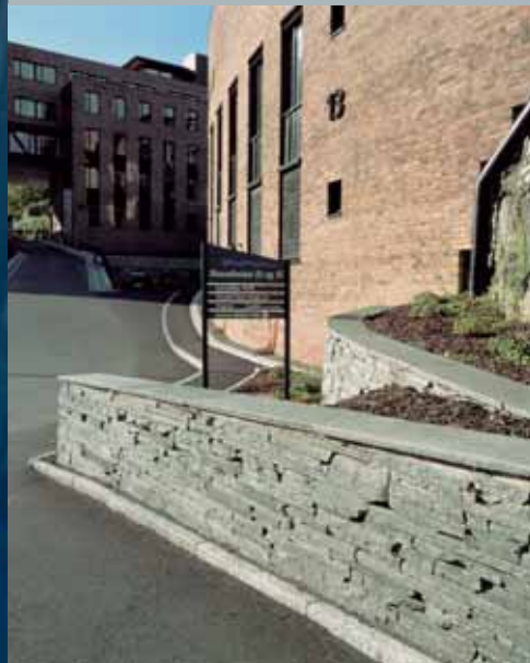
Tørrmur med avdekningsheller.