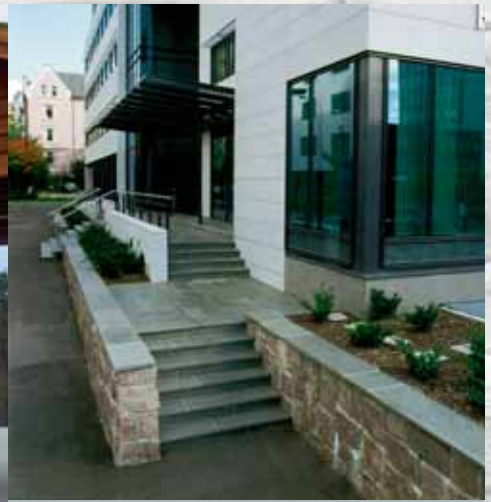
Trapp med repos. Avdekningsheller på muren.