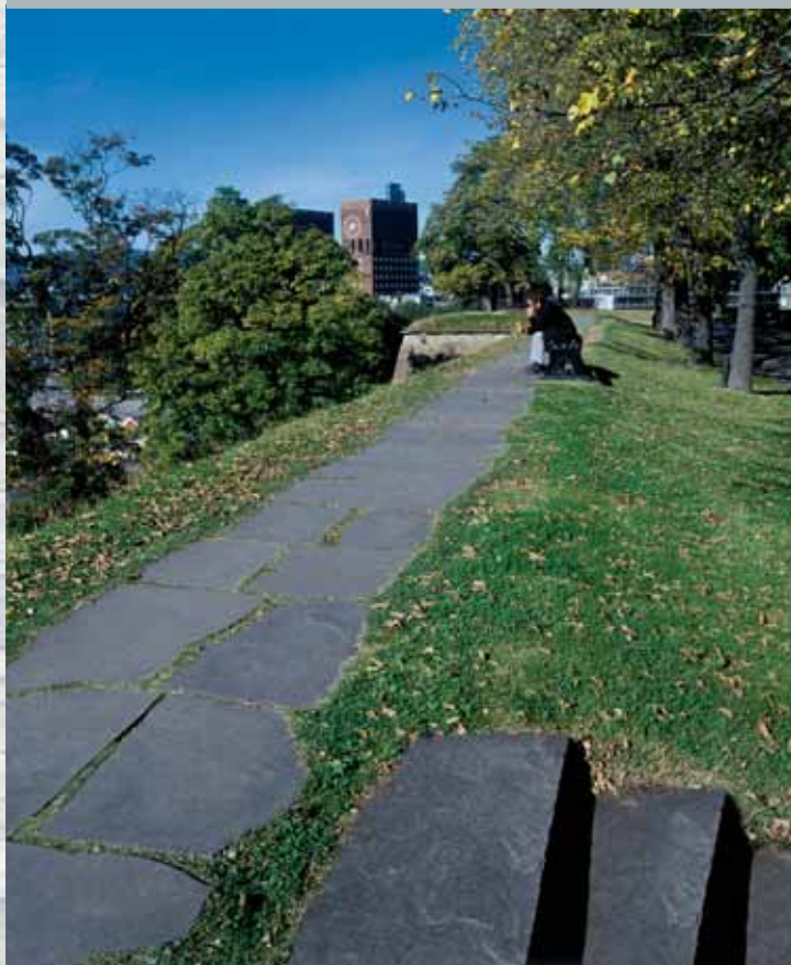
Bruddheller og terrengtrinn på Akershus festning.