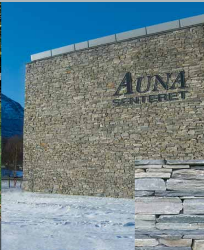
Vegg av tørrmur og murekapp på kjøpesenter.