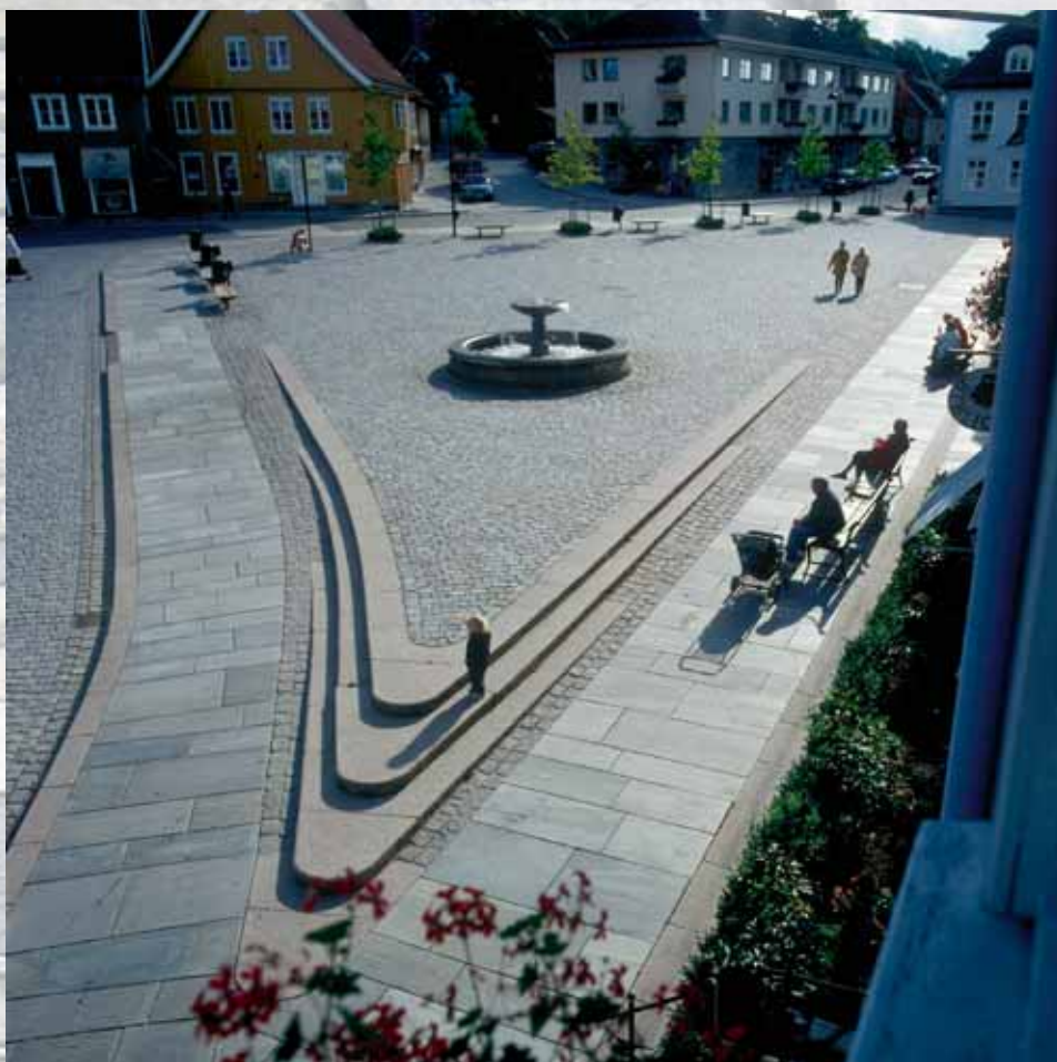
Skiferbelegning på torg i kombinasjon med granitt.